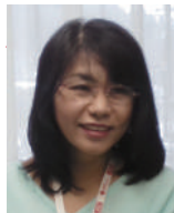
看護学部看護学科教員 情報・広報委員会委員長