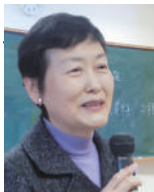
日本赤十字秋田看護大学 日本赤十字秋田短期大学 学長